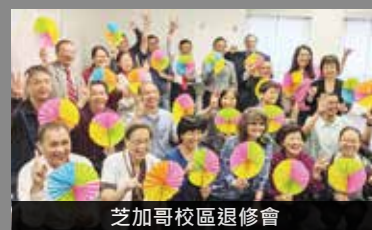
芝加哥校區退修會