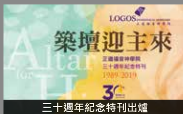
三十週年紀念特刊出爐