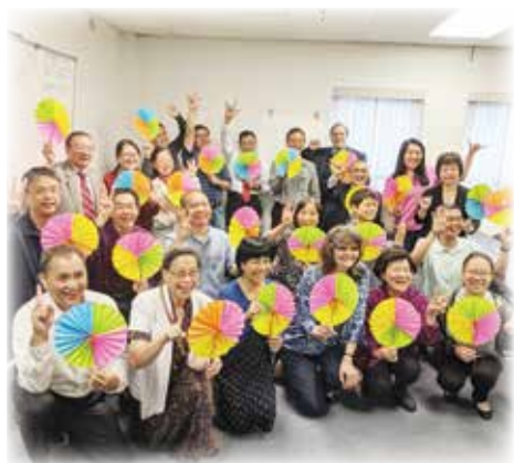
6 月 15 至 16 日，芝加哥校區舉行退修會，近 35 位牧者、理事、校友、神學生以及同工參加。