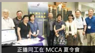
正道同工在 MCCA 夏令會