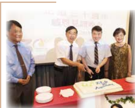
正道 30 週年感恩餐會於華盛頓特區舉行。