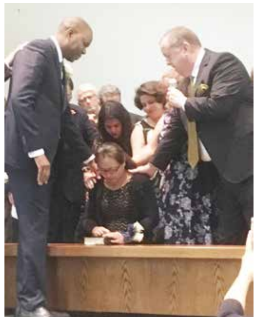
按牧典禮當天的情景。

按牧不是一個結束，而是繼續跟從神的一個新的起點。願在此與眾校友、在校學弟學妹們共勉——「仰望為我們信心創始成終的耶穌」（來 12：2），定睛在祂身上，緊緊跟隨祂；憑祂所賜的信心領受神給我們每一位的產業，擔負起祂給我們每一位的使命；用我們的生命去事奉祂，敬拜祂。