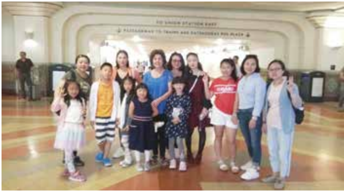
中英雙語幸福課堂春遊。

2019 年 5 月 4 日，是我被按牧的日子。隨著這日子的臨近，時不時會收到同工、會友或者朋友各種形式的提醒和恭賀，心情也開始忐忑不安。特別分出時間，放下手頭的工作，安靜在我們慈愛的天父面前，求聖靈的帶領，審視自己的內心，看到心中的焦慮和壓力，越發認識到自己的不配和軟弱，再一次徹底在上帝面前認罪悔改，將自己交託在慈愛天父手中。