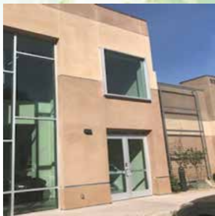
Building A 外觀