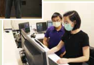
網路連線，蓄勢待發。