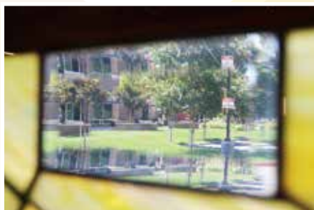
疫情期間的正道校園格外寧靜。「你們要休息，要知道我是神！」（詩篇 46：10）