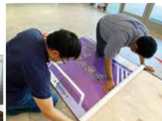
▲ 拓展處同工為「教牧論壇」製作背景。