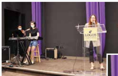
用敬拜讚美預備心。