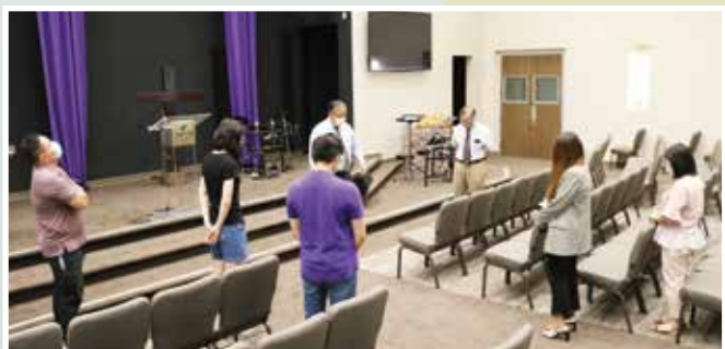
會前禱告，保持「社交距離」，心依然緊緊相連。