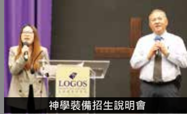
神學裝備招生說明會