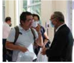
特會現場，賓客雲集。