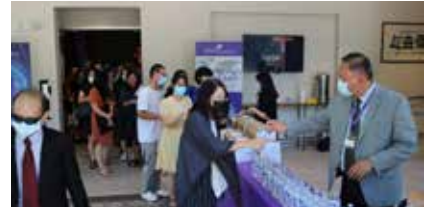
現場贈送精美點心。

美國晚婚、不婚的現象日趨普遍。2018 年全美 25 至 50 歲適婚年齡的人口中，有 3900 萬人從未結婚；在不到 20 年間，這樣的人口比例增加了 14%（從 21% 增至 35%）。相對不婚者，已婚者比較健康（physical）、喜樂（emotional）、富裕（financial），而結婚者較多是有堅定宗教信仰的人；但可惜的是，此群體亦日漸減少。