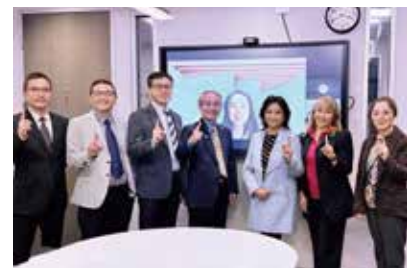
學務處同工集體照

感謝神！自 2019 至 2025 年，學務處在劇變中走過了七年。「七」在聖經中表示「完美、神性、完整和屬靈的豐盛」，我們所有學務處的同工們，並不以目前所達到的目標為滿足，因為知道擺在我們面前，仍有許多未知的挑戰。相信所有正道人，仍將會繼續抱持使徒保羅的精神——忘記背後，努力面前，向著主所給我們的標竿直跑！（腓 3:13-14）不負所託，直到見主面！✠