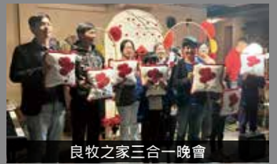
良牧之家三合一晚會