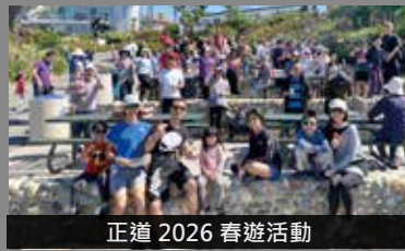
正道 2026 春遊活動